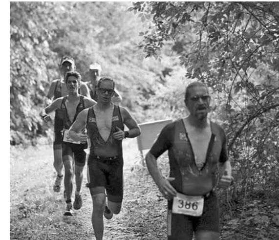
Laufen im Grünen in Fuldataal

Die beiden Teams in der 4. und 5. Liga holten auf dem Rad ordentlich auf und ließen beim Laufen keine Mannschaft mehr vorbeiziehen. Die Anstrengungen wurden mit dem 5. und 9. Tagesplatz belohnt.