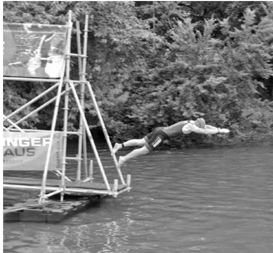
Wie früher am See - als Erwachsener aber im neuen Tria-Suit

Der Wettkampf bestand aus einem Swim (250 m) and Run (2,5 km) sowie dem eigentlichen Triathlon (500 m – 14 km – 5 km). Am Start waren alle drei Spiridon Männerteams, da der Wettkampf für die 3. bis 5. Hessenliga geschrieben war. Die Besonderheit des Triathlons bestand darin, dass alle Teilnehmer nacheinander mit einem Abstand von 15 Sekunden von einem extra aufgebauten Steg mit kühnem Sprung ins 22,8 Grad warme Wasser springen mussten. Einige Starter wählten statt des Sprungs eine vorsichtige Variante, andere Starter beklagten den Verlust von Brille und/oder Badekappe.