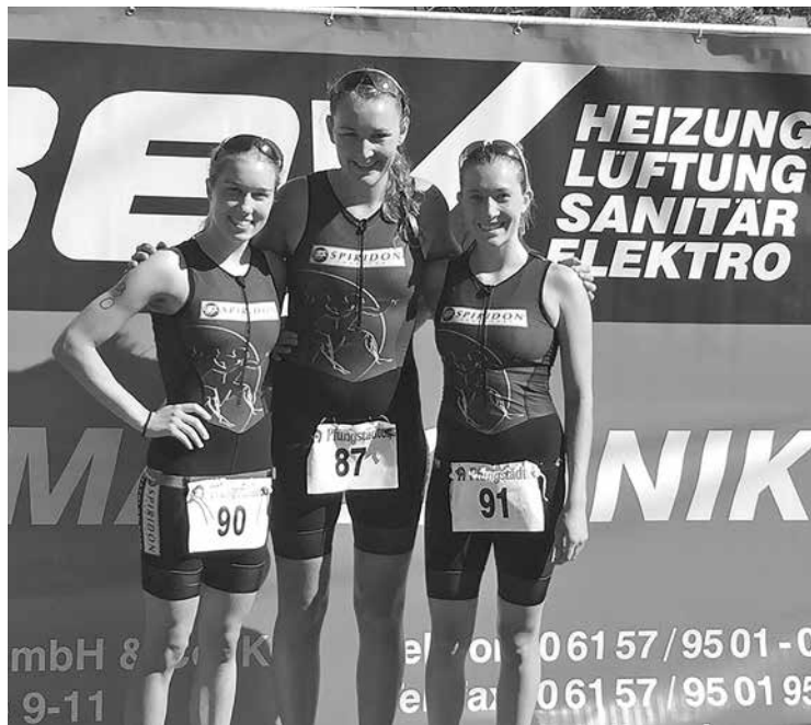
Griesheim, ein Vorbereitungswettkampf für die Regionalliga und Sprint-Hessenmeisterschaften