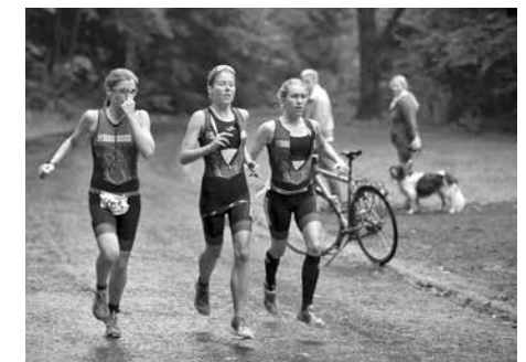
Teamsprint in Fuldata. War etwas matschig dort...