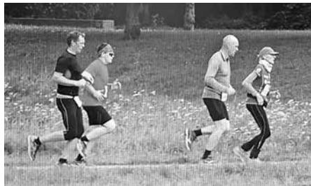
Weibliche Tempomacherin vor drei „gestandenen Kerlen“

Aber dieses Mal werden es weder die tollen 10km, noch die sehr gute Organisation oder meine Zielzeit in der AK65, die mich in erster Linie daran erinnern. Nein, es werden die drei großen Kerle hinter mir, die mich ohne mein Wissen ausgesucht haben, deren Pacemaker zu sein.