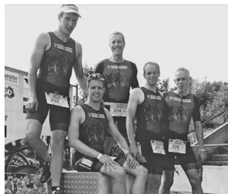
Unsere Jungs auf dem Treppchen. Erfolgreicher Abschluss einer guten Saison!

fahrspezialisten. Der abschließende Lauf mit 3 Runden a 3,33 km war mit dem Stadion als Stimmungsnest und mehreren Wendepunkten übersichtlich und gut zu laufen. Athleten, die nicht so schnelle Schwimmer aber gute Bergziegen sind, können bei diesem Wettkampf also noch gute Gesamtergebnisse erzielen. Auch der letzte Wettkampf war für die 3. bis 5. Hessenliga ausgeschrieben. Beste Rennbedingungen versprachen spannende Wettkämpfe. Vor dem letzten Rennen der Saison lagen unsere erste und zweite Mannschaft jeweils mit Tabellenplatz 3 auf dem letzten Aufstiegsplatz, den sie mit guten Ergebnissen hart erarbeitet hatten. Das Ziel war klar definiert, ein solides Mannschaftsergebnis sollte zur Verteidigung der Tabellenplätze ausreichen. Die Anstrengungen hatten sich am Ende nicht nur wegen des gleichzeitig startenden Sebastian Kienle gelohnt. Die Mannschaften der 3. und 4. Liga konnten ihren Aufstieg mit dem 3. bzw. 5. Platz in diesem Wettkampf perfekt machen.